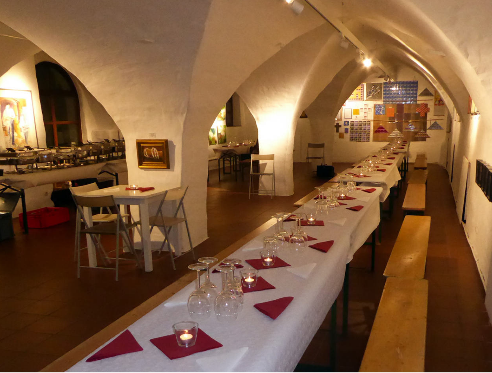
Abb. 45: : Festliche Galerie