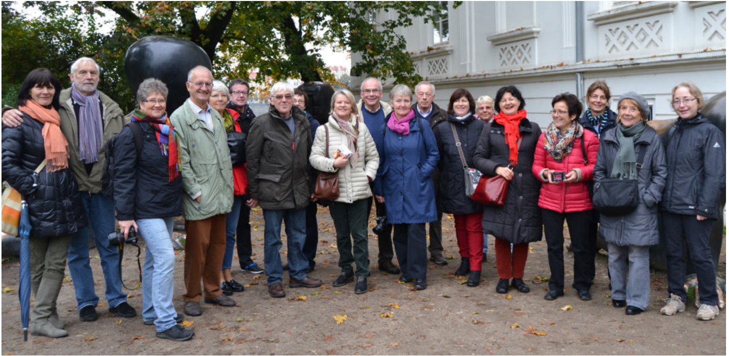
Abb. 44: Kunstfahrt nach Prag