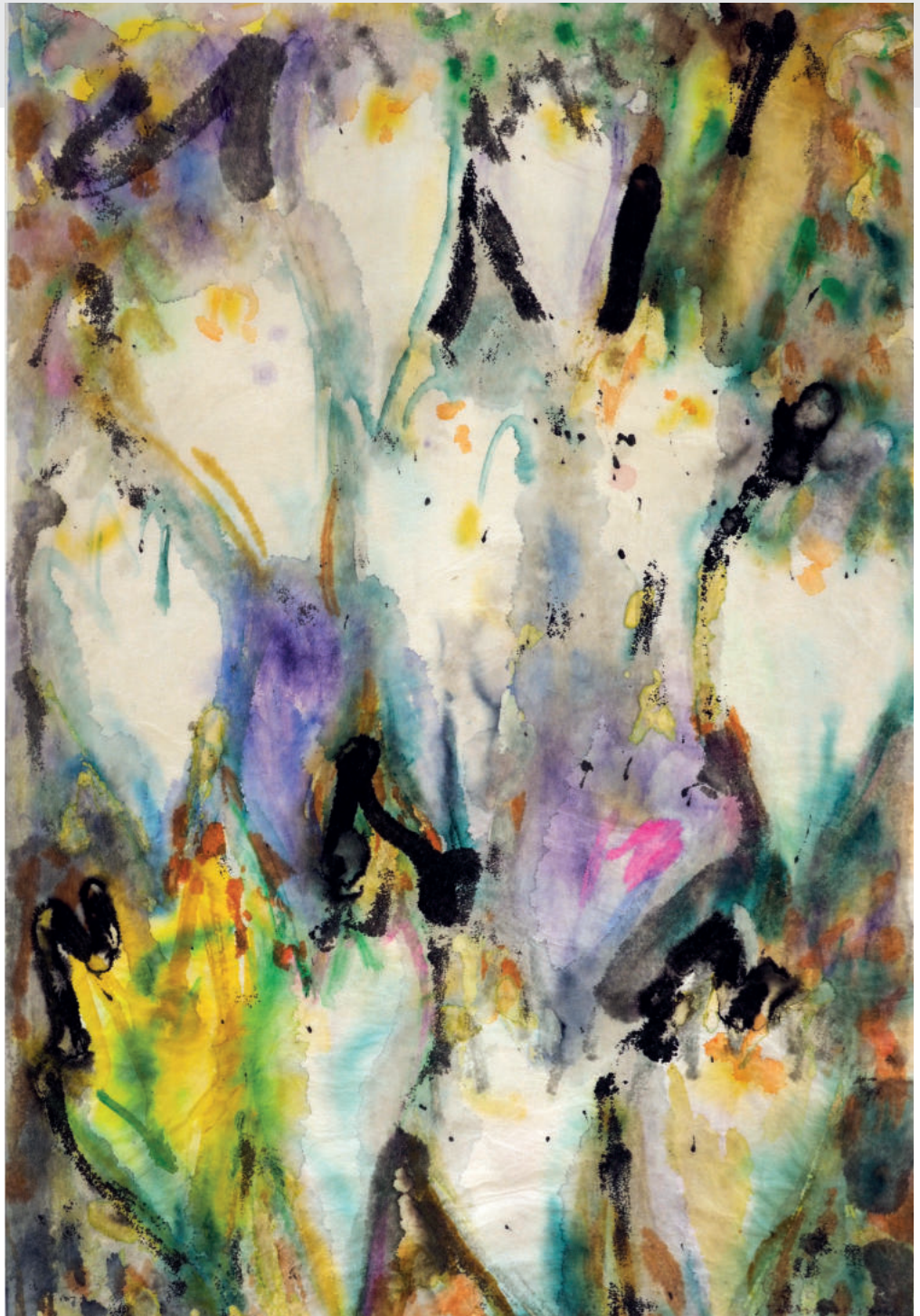
Abb. 38: Werner Trautmann: Blumen, Aquarell, 1978, 67,9 x 45,1 cm, Eigentum Margot und Peter Feser.