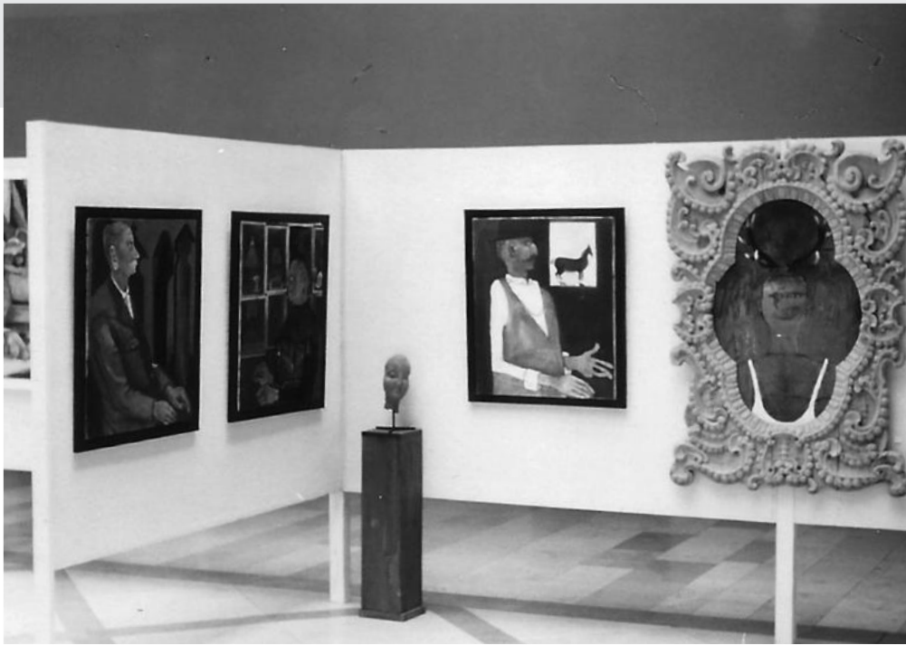
Abb. 24, 25: Kunstausstellung des Künstlerbundes im Atrium des AKG Schwabach, 13.–22.05.1967