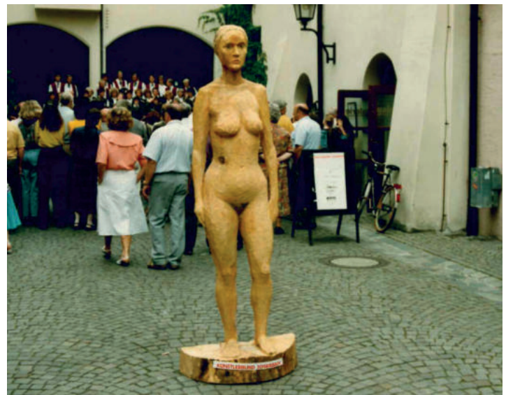
Abb. 34: weibliche Aktfigur aus Holz von Clemens Heintl, Schwabach 1991