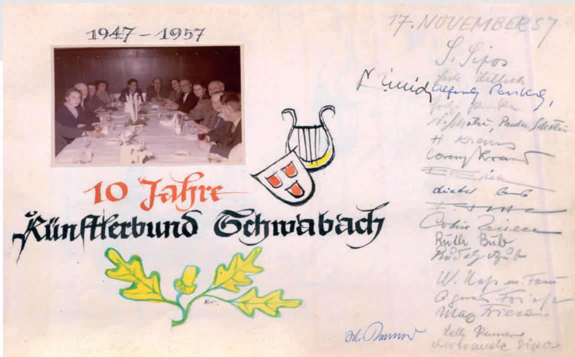
Abb. 19: Seite aus dem Tagebuch des Künstlerbundes vom 17.11.1957, Stadtarchiv Schwabach, Inv. Verz. XIII. G. 4.