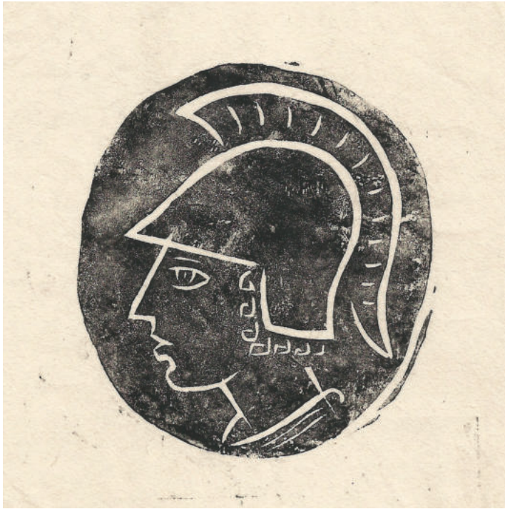
Abb.2: Soltan Sipos, Entwurf zum Vereinseblem mit dem Haupt der Pallas Athene im Profil nach links, ca. 15,4 x 13,3 cm, „Archiv Künstlerbund Schwabach“.