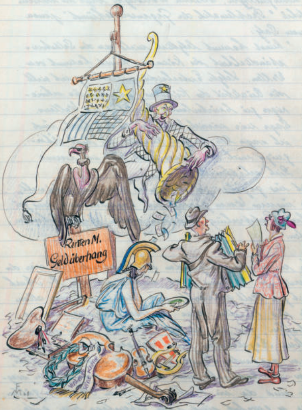
Abb. 12: Doppelseite aus der Chronik des Künstlerbundes, S. 18 (Text: Else Opitz, Illustration: Max Friese), 1948, Stadtarchiv Schwabach, Inv. Verz. XIII. G. 2.

Ich weiß nicht was ich ich noch danken, Was fange ich An was sein zu Ich schuldig begibt sich zu abgeben