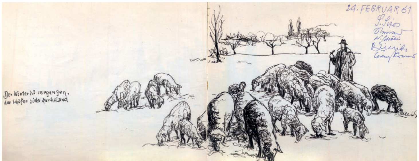
Abb. 20: Othmar Zillich, Illustration einer Doppelseite im Tagebuch des Künstlerbundes, „Der Winter ist vergangen, der Schäfer zieht durchs Land“, Feder und schwarze Tusche, 24. Februar 1961, Stadtarchiv Schwabach, Inv. Verz. XIII. G. 4.