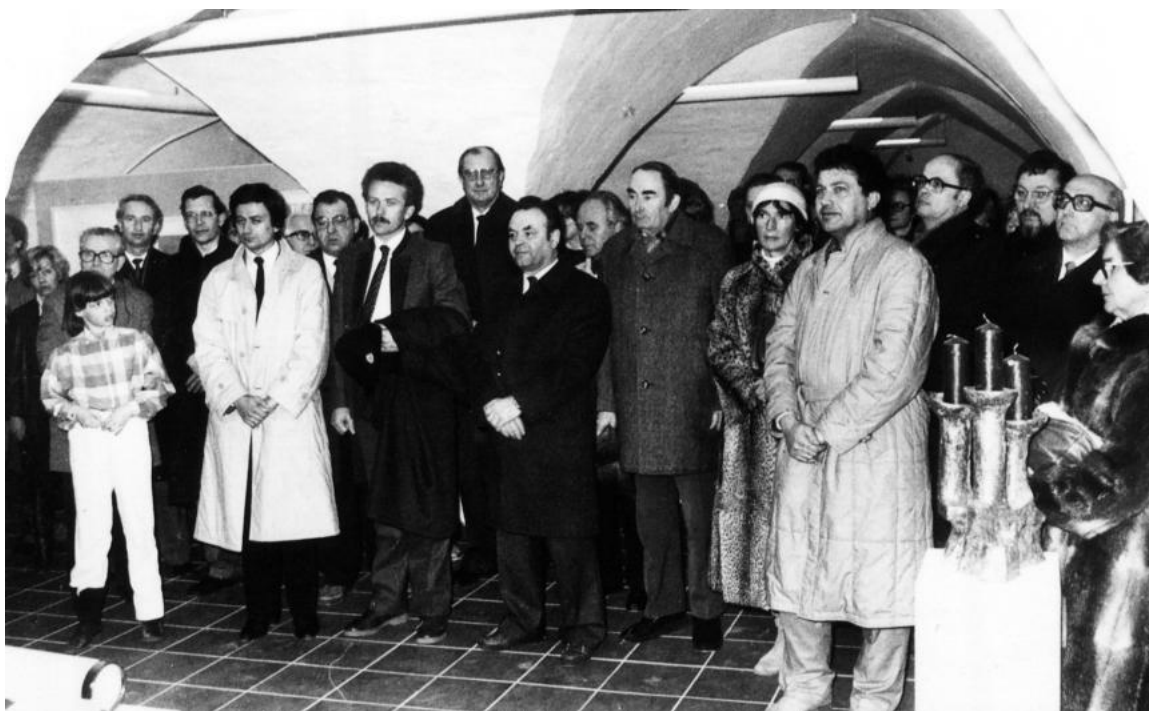
Abb. 27: Eröffnung der ersten Ausstellung des Künstlerbundes in der neuen Galerie im Dezember 1983. Stadtarchiv Schwabach, Inv. Verz. XIII. G. 44.