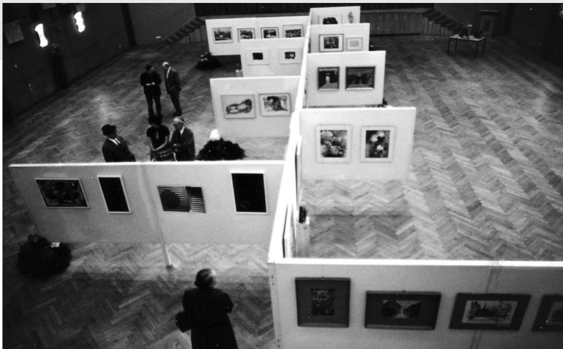
Abb. 26: Kunstausstellung im Markgrafensaal vom 19.–30. Juni 1971, „Archiv Künstlerbund SC“.