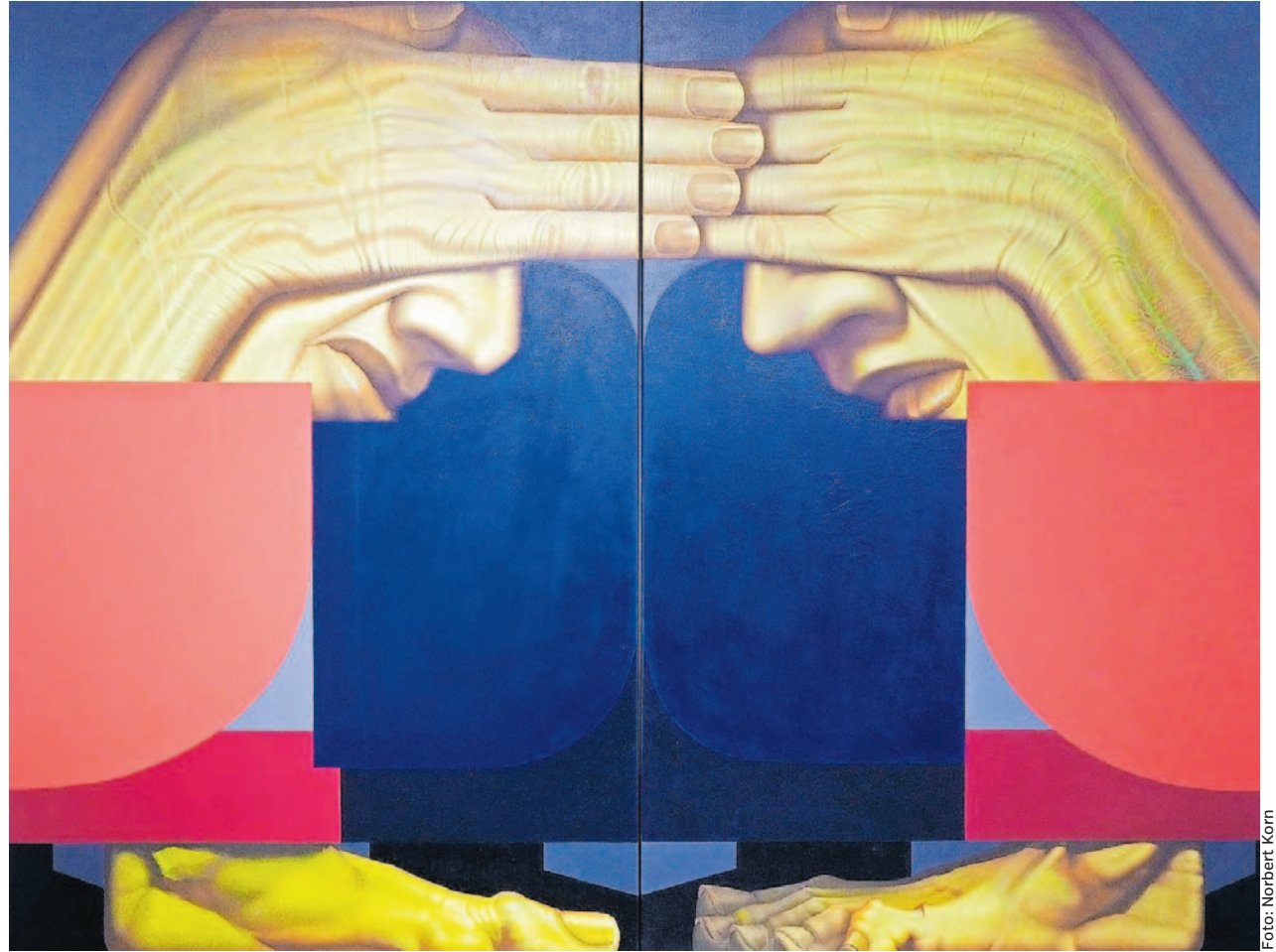
Aus der Serie „Kain und Abel“ stammt dieses Bild von Peter König. Nur scheinbar einander zugewandt, offenbart die Stellung der männlichen Köpfe Hass und Brutalität der Menschen.

Dem „Urteil des Paris“ nachempfunden, zeigt Niklaus in ihrem zweiten Bildwerk einen jungen Mann, der