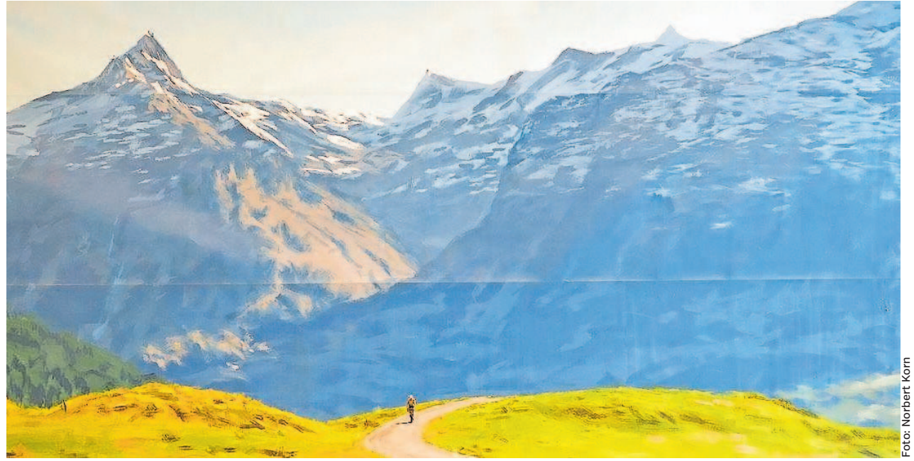
Das Plateau hat der Nürnberger Künstler Axel Gercke gemalt.

Gemalt auf einer höchst beeindruckenden, überdimensionalen Malfläche, die ursprünglich eine handelsübliche Tapetenrolle war, vermittelt das Werk durch die materialbedingten, leicht gewellten Kanten eine zusätzliche Dynamik. Dem gewaltigen verschneiten Bergmassiv